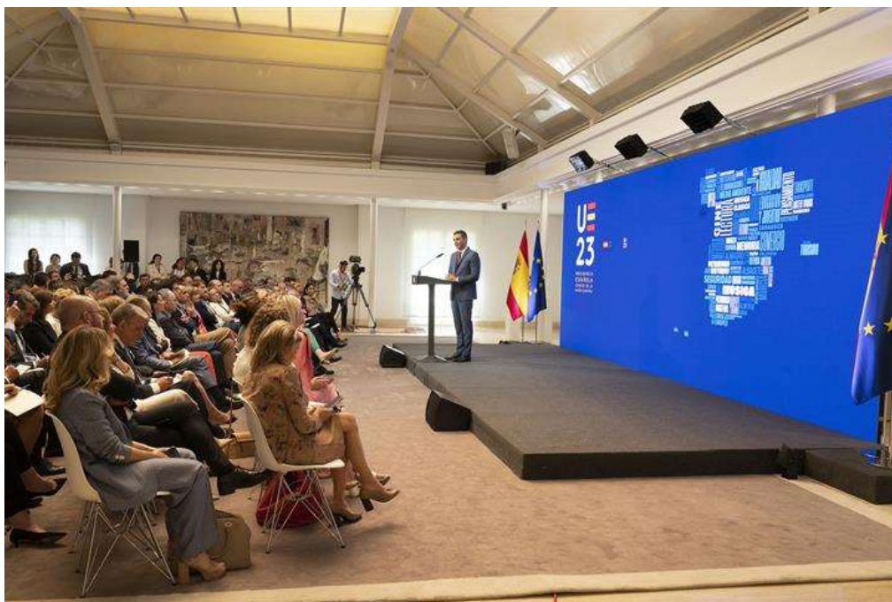
El presidente del Gobierno, Pedro Sánchez, durante su intervención para presentar los cuatro grandes ejes de la Presidencia española de la Unión Europea.

Además, tal y como ha explicado el presidente del Gobierno, España priorizará la adecuada revisión del Marco Financiero Plurianual 2021-2027, y trabajará "para alcanzar una reforma de las reglas fiscales que permita acabar con las políticas austerizadas que tanto daño hicieron durante la crisis financiera de 2008". Una reforma que logre avanzar en la senda de la transparencia y permita combinar la sostenibilidad de las finanzas públicas con la correcta financiación de las transiciones verde y digital.