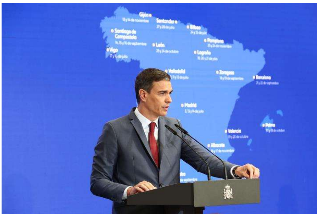
El presidente del Gobierno, Pedro Sánchez, durante su intervención para presentar los cuatro grandes ejes de la Presidencia española de la Unión Europea.

El presidente Sánchez ha afirmado que Europa se perfila hoy a ojos del mundo como un espacio "seguro y amigable", una región que cuenta con todos los ingredientes necesarios para liderar la economía del futuro, como lo son el talento, la innovación, una posición geopolítica privilegiada, estabilidad institucional, energía limpia, infraestructuras punteras y un ecosistema empresarial de primera.